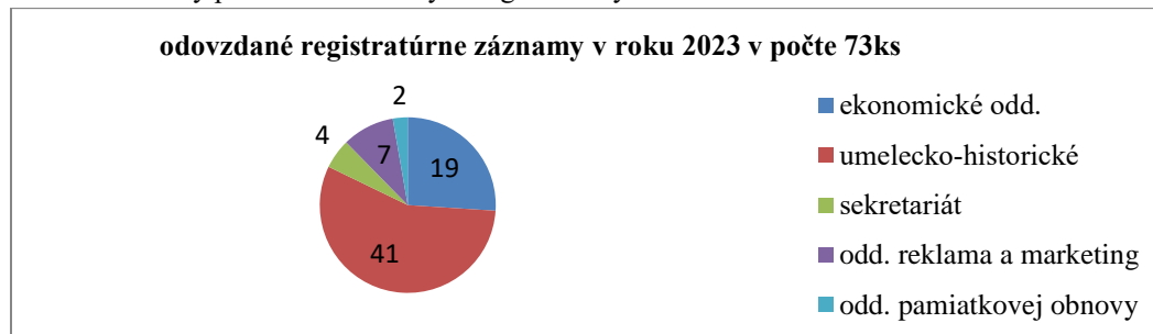
Graf č.1: Ročný prehľad odovzdaných registratúrnych záznamov v MSA